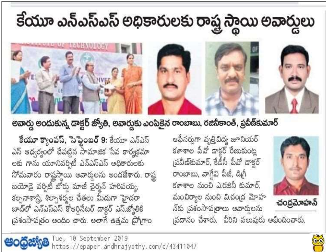
News coverage of Best NSS Programme officer in Andhrajyothi E paper on 10- 09-2019