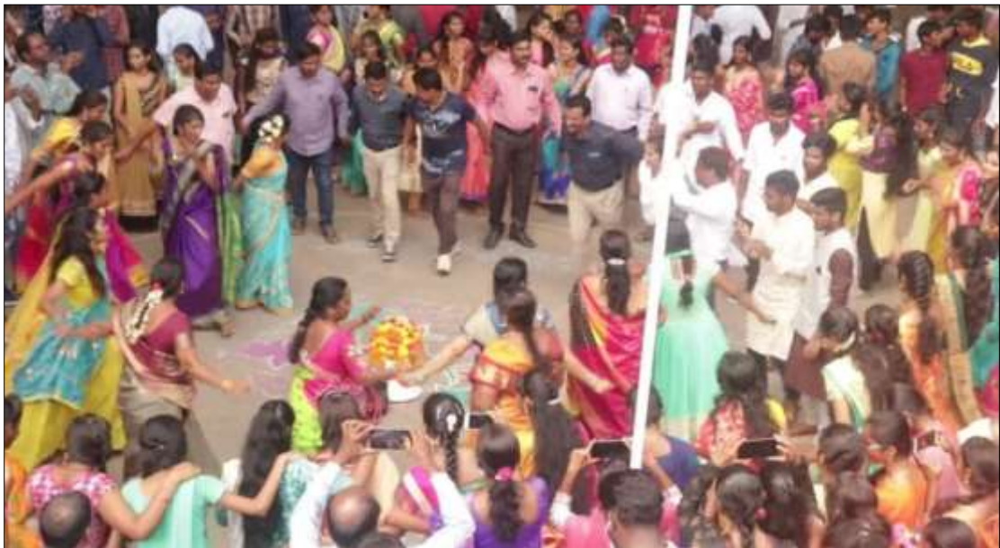
The Girl students roaming around the Batukammas by singing songs