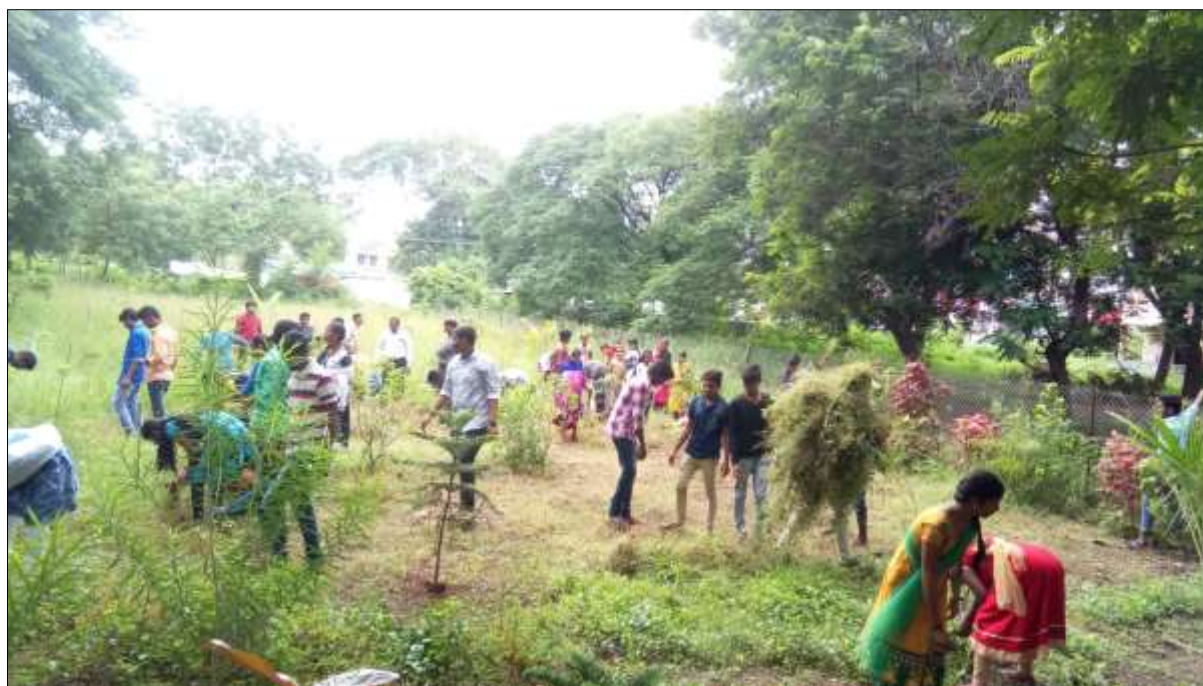
Students participating in Swachh Bharath programme in Botanical Garden on 19.02.2020