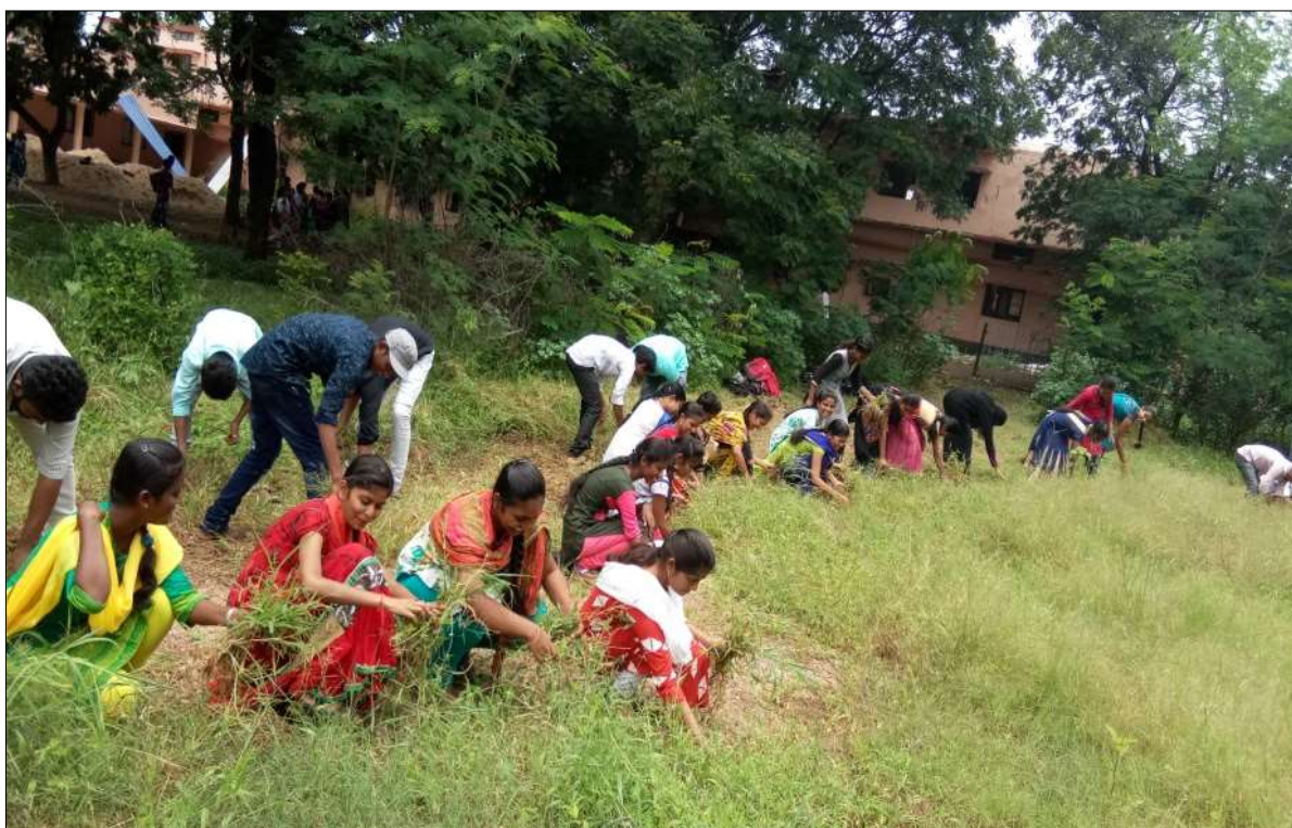
Students cutting the grass and weed in the garden on 11-01-2020