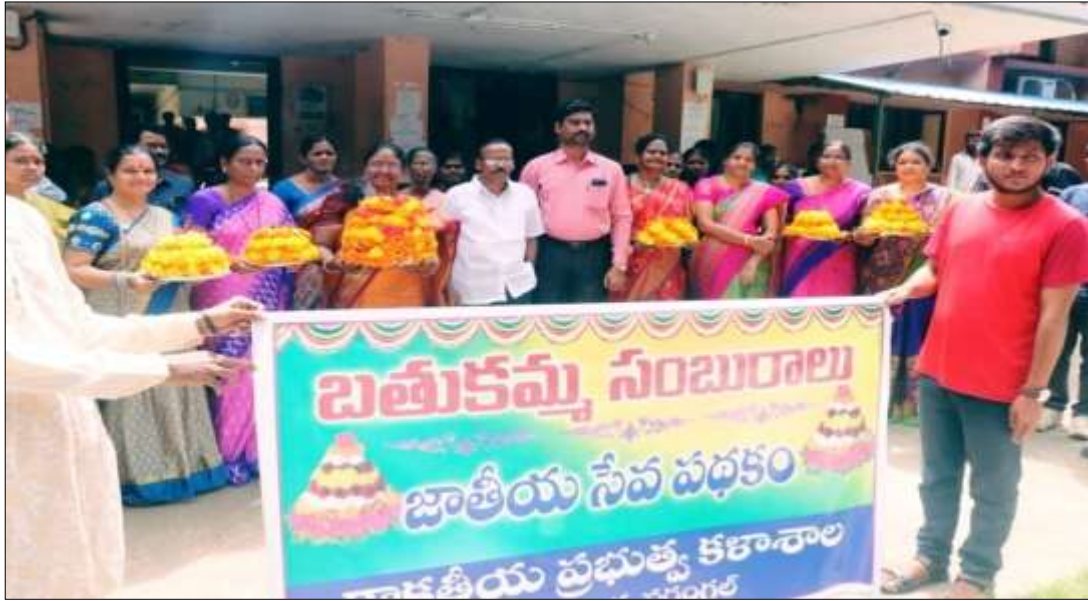
All women faculty members with Batukammas

Batukamma state festival was celebrated with pomp and joy in association with Women Empowerment cell and NSS Units of Kakatiya Government College on 27-09-2019. The objective of the program is to encourage the Girl to live with honour and pride. Batukamma is a celebrated though out the state of Telengana during Durga Navaratri. This festival implies the victory over the evil.