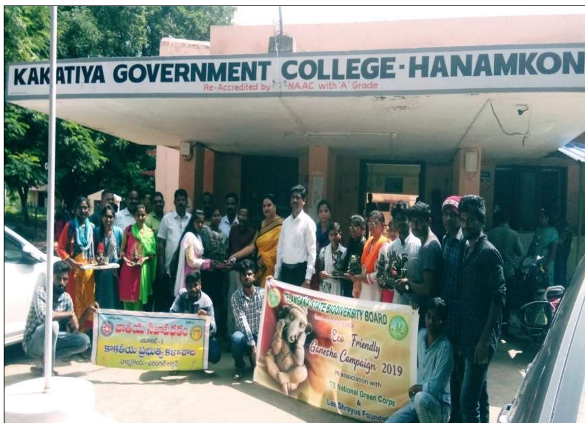
Distribution of Clay Vinayaka Idols to the people on 30-08-2019