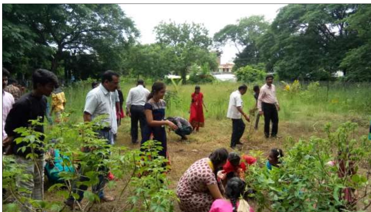
Volunteers participating in Swachh Bharath programme on 30-10-2019