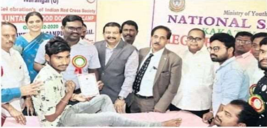
రక్తదానం చేసిన వలంటీర్లకు సర్టిఫికేట్లను ఇస్తున్న కలెక్టర్