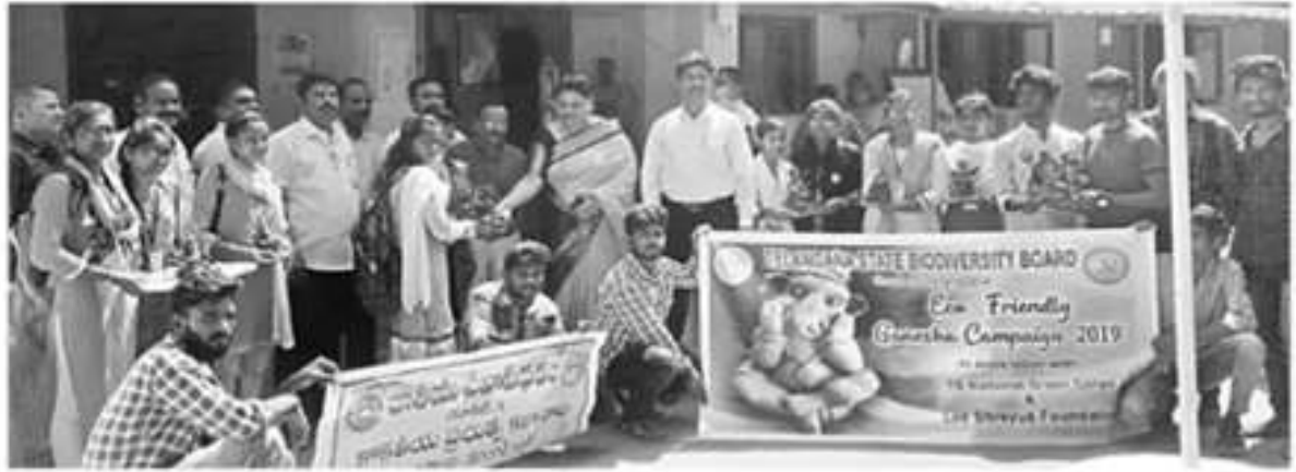
మట్టి వినాయక విగ్రహాలను పంపిణీ చేస్తున్న కేడీసీ ప్రెసిసిపాల్, అధ్యాపకులు