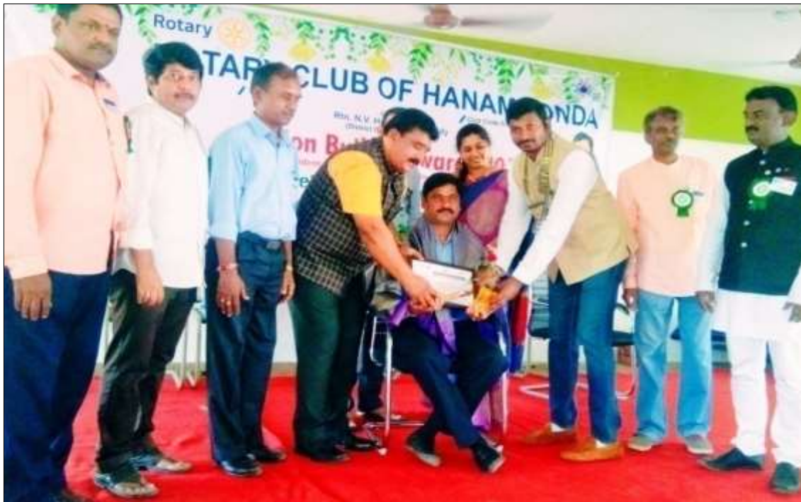
Receiving “Nation Building Award” on 28-09-2019