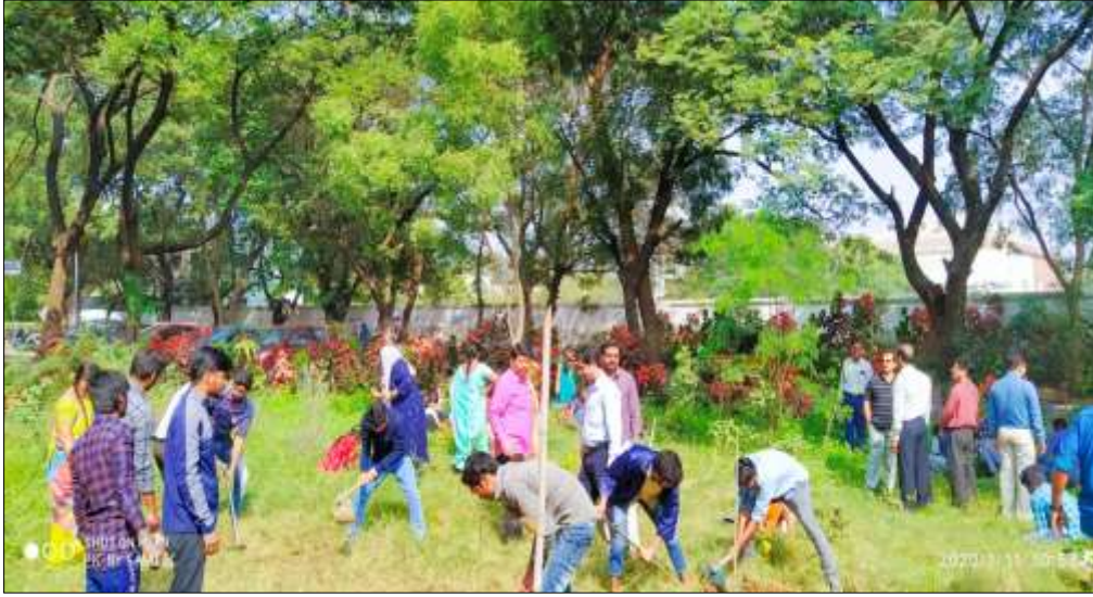
Students participating in the clean and green program

One-day special camp was organized by NSS Unit I (Sciences) in Botanical garden on 26-08-2019. The main objective of the programme is to enable the students to know the various medicinal plants. The volunteers and students of science sections removed the weed, grass and additional branches of the trees. The Programme officer Dr. M. Rambabu and faculty members of science sections participated in the programme.