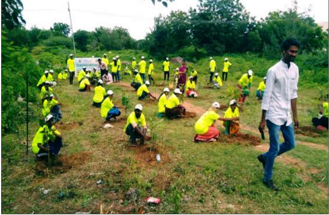
NSS Unit I Volunteers active participation in planting the saplings at ladies Hostel premises of Kakatiya University Warangal